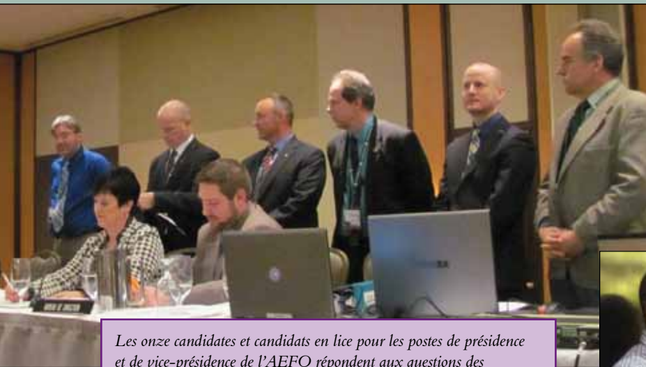
Les onze candidates et candidats en lice pour les postes de présidence et de vice-présidence de l'AEFO répondent aux questions des congressistes.

Grâce à un système de vote électronique, les votes ont été comptabilisés rapidement à chacun des nombreux tours de scrutin requis pour combler tous les postes.